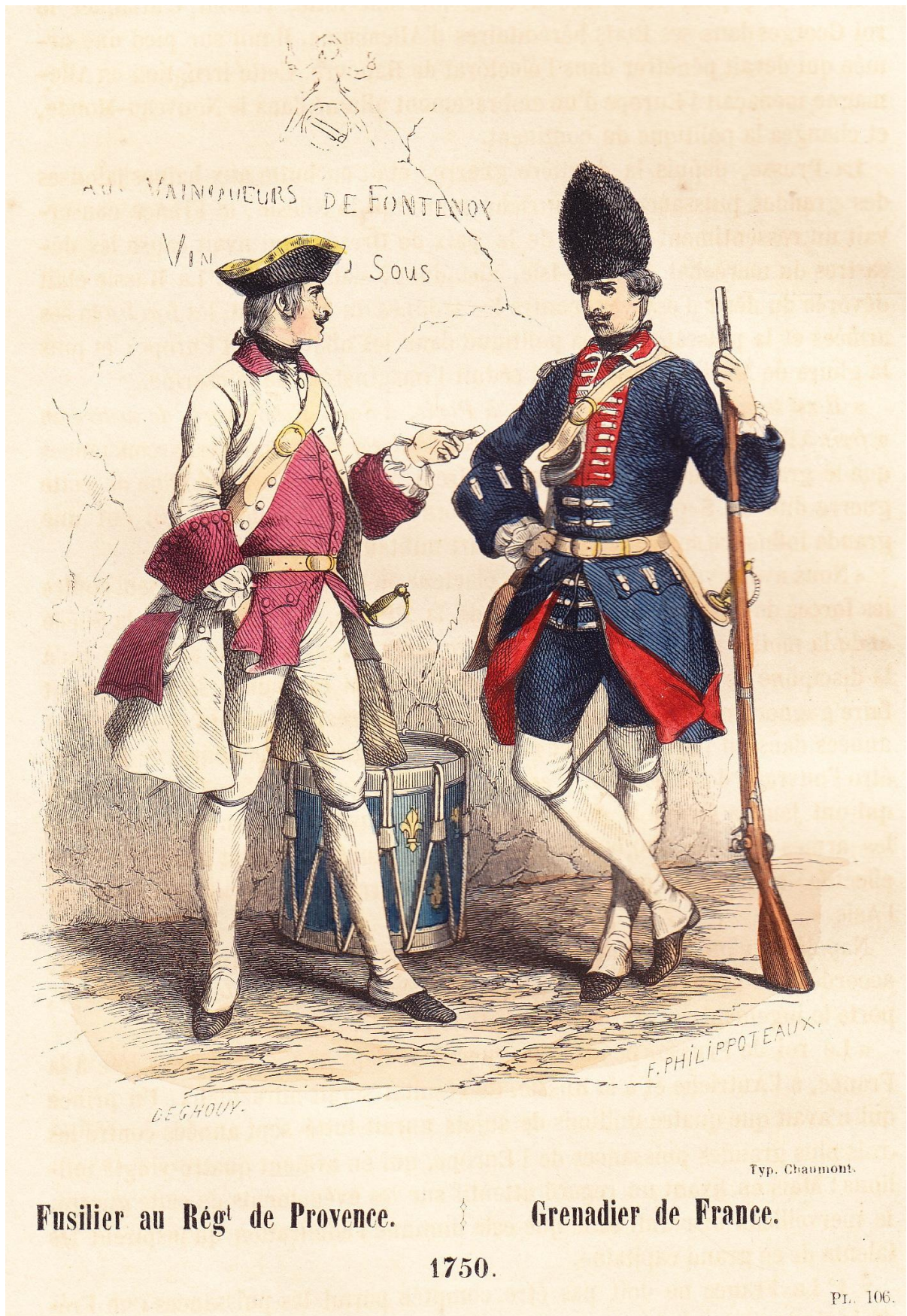
Dans Histoire de l'armée et de tous les régiments depuis les premiers temps de la monarchie française jusqu'à nos jours (1860, tome II).